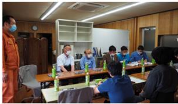
上写真：工場視察の風景